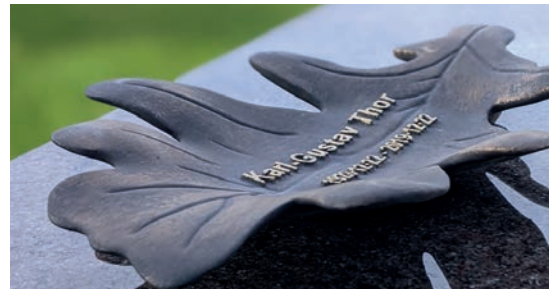
Eklöv i 3D