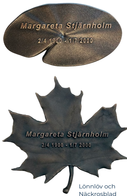
Lönnlöv och Näckrosblad