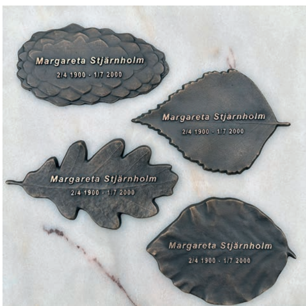
Uppifrån och ner: Grankotte, Björklöv, Eklöv och Boklöv

Texten har en relief på 2 mm ovanför lövet/kotten och är slipad och blir ljusare än motiven. Resten av skylten är polerade för hand så små detaljer som ger en levande effekt och naturlig effekt.