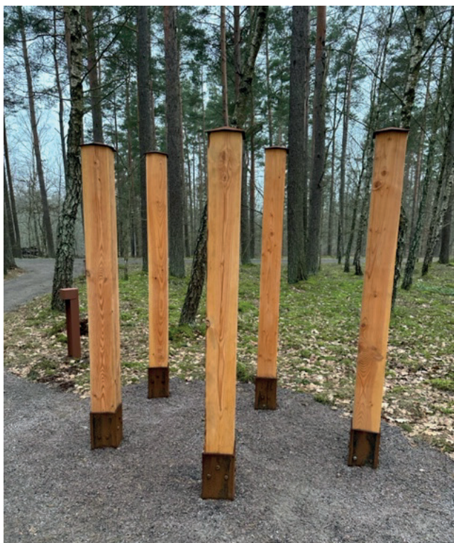
Norra Kyrkogården, Hässleholms församling

På Norra kyrkogården i Hässleholm står träpelare som en samling träd i en skog med bronsskyltar från vår serie "Skogsgläntan".