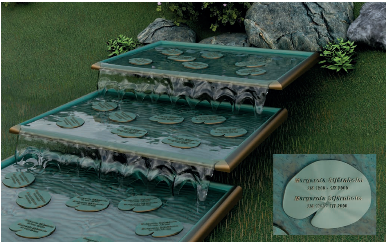
VATTENTRAPPA AV BRONSFAT MED NAMNSKYLTAR SOM NÄCKROSOR