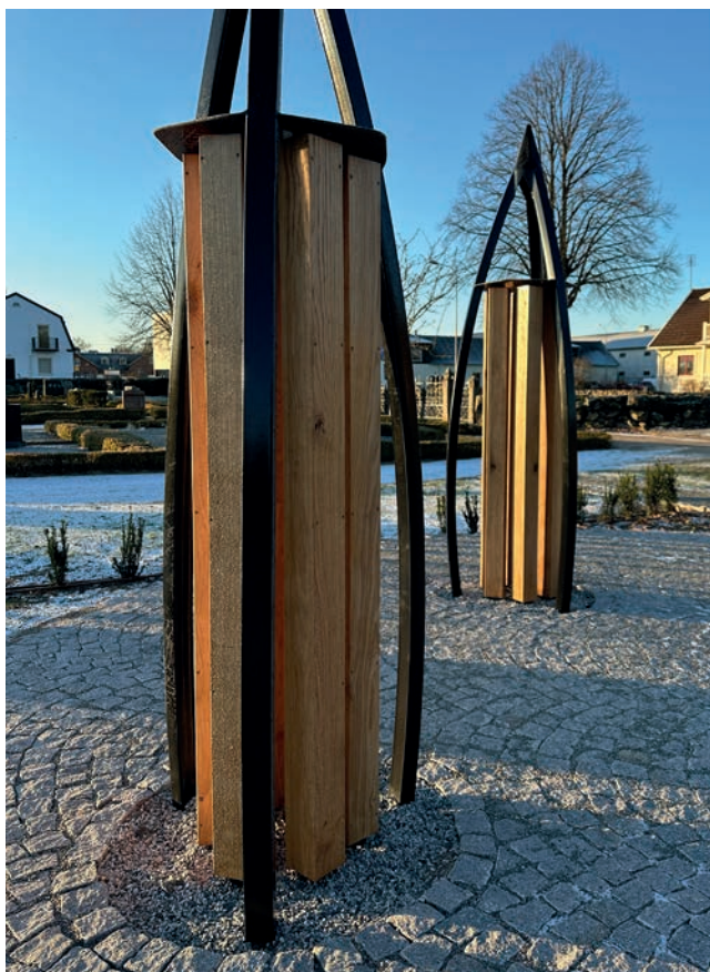
Träpelare och blomsterhållare, Vinslövs församling

I Vinslöv har församlingen samarbetat med en lokal smed där de tillsammans designat bågar som ramar in träpelare, blomhållare och ljushållare. En vacker installation där allt hänger ihop. Vinslöv har valt bronsskyltar till pelarna.