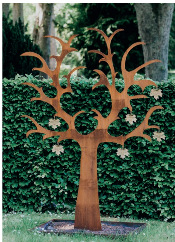
Fem minnesträd i Lunds Norra kyrkogård. Träd i COR-TEN®, producerad av Weland Design™.