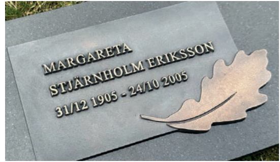
Eklöv från nya serien "Skogsglädjan 2024".